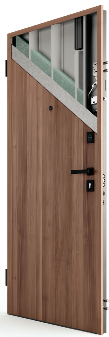
altezza maniglia 1050 mm

Classe antieffrazione 4 anche per porte a 2 ante e per configurazioni finestrate e/o con sopra luce/fiancoluce.